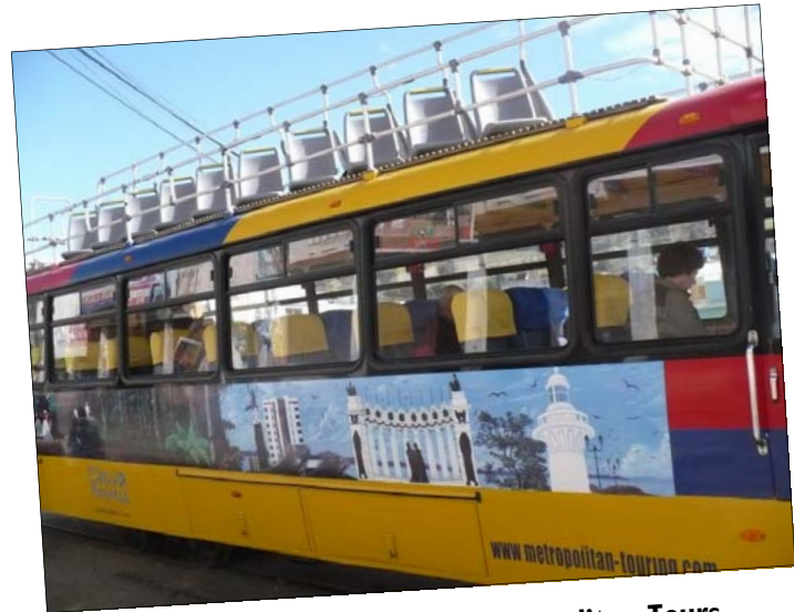
De Chiva, een speciale bus van Metropolitan Tours waarmee verschillende keren per week groepen toeristen langskomen voor een kort bezoekje aan Inti Sisa.