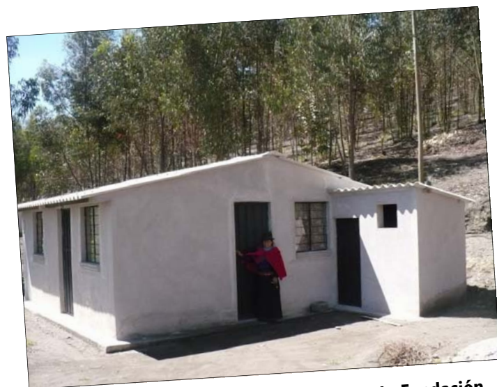
Onze medewerkster en stichtend lid van de Fundación Juanita voor haar nieuw huisje.