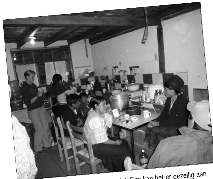
In de keuken van het gastenhuis van Inti Sisa kan het er gezellig aan toe gaan.