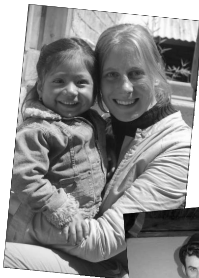
Liesbet met indigenameisje