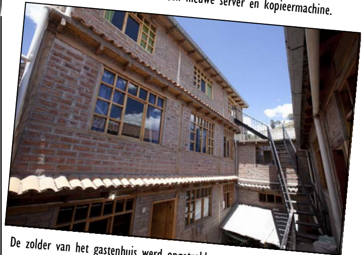
De zolder van het gastenhuis werd opgetrokken en biedt plaats aan vier nieuwe gastenkamers.