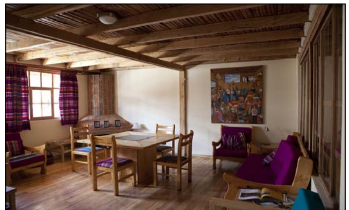
Het oude directeursbureau werd omgevormd tot een nieuw gezellig salon, zodat grotere groepen voldoende ontvangtruimte hebben.