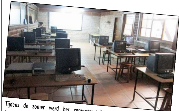
Tijdens de zomer werd het computeratelier aangepakt, alle computers kregen een onderhoud en er kwam een nieuwe server en kopieermachine.