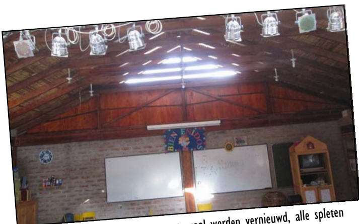
De voor- en achterkant van de grote zaal werden vernieuwd, alle spleten zijn weg en het nieuwe hout blinkt ongelooflijk.