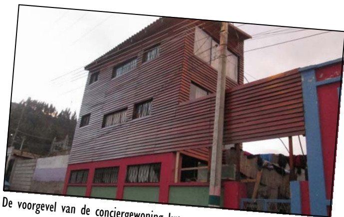
De voorgevel van de conciërgewoning kreeg een nieuwe beurt.