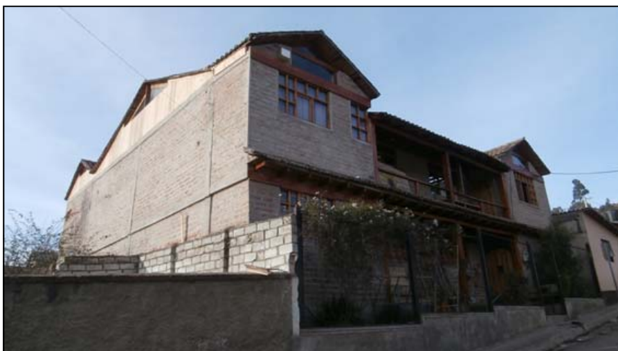
Vernieuwing van binnen en van buiten. De grote houten driehoeken van de grote zaal boven en de ramen van Inti Sisa II werden vernieuwd. Weg met de reten en de kou! Onderaan links, achter de muur komt de nieuwe speelplaats van ons "Kleuteronderwijs".