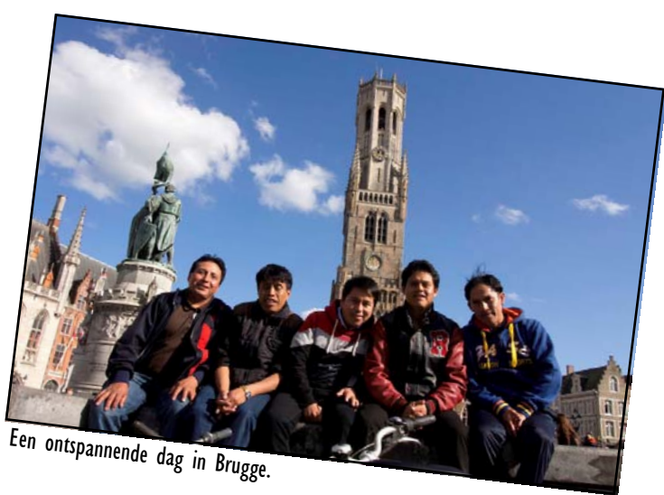
Een ontspannende dag in Brugge.