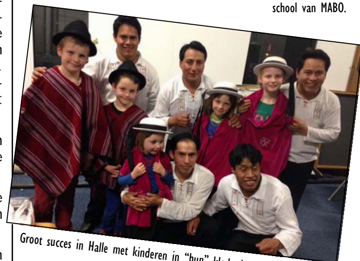
Groot succes in Halle met kinderen in "hun" klederdracht.