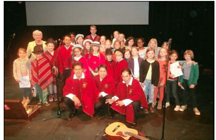
Optreden in het Bronks theater in Brussel, met kinderen van de lagere school van MABO.